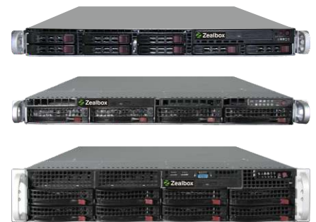
Zealbox Server sind auch im Rackmountgehäuse lieferbar.